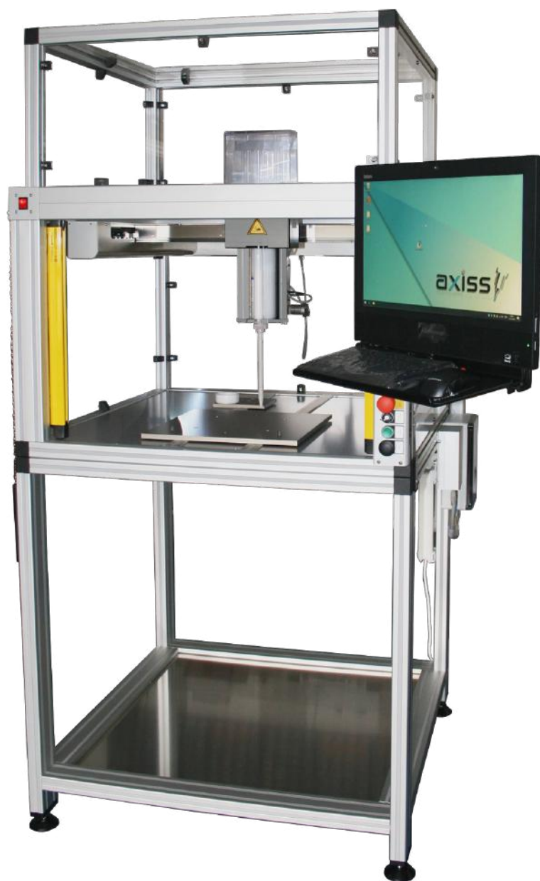
Abbildung mit Art. 3003 Unterbau und Art. 3103 Haube